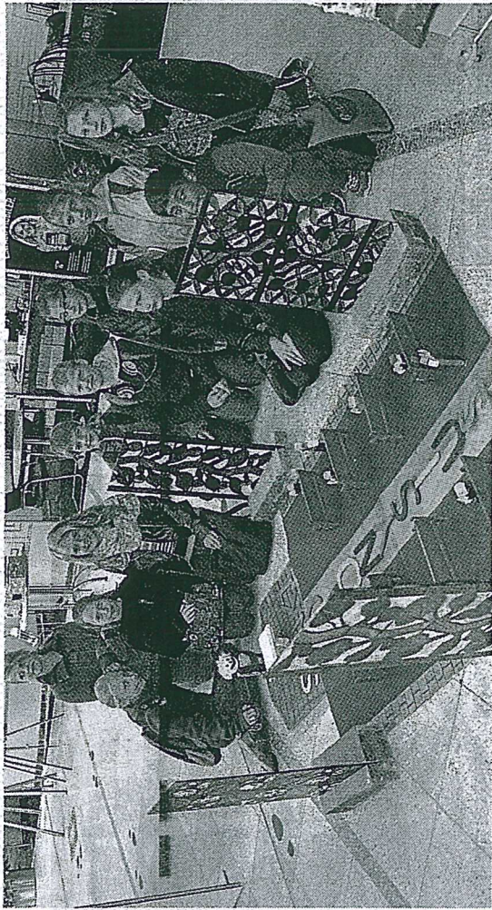
Stolz betrachteten die Fünftklässler aus Mesum ihre Arbeiten in der Ausstellung „Historische Meile“.

Denn im Rahmen ihrer Projektstage hatten sich die Jungen und Mädchen im Oktober 2013 mit dem Thema beschäftigt, die historische Innenstadt und die Dionysius-Pfarrkirche erkundet und dazu viele Fotos geschossen. Daraus erstellten sie eine Collage und daraus wiederum ein Plakat. Erstaunt stellten sie dann fest, dass gerade diese ihre Arbeit